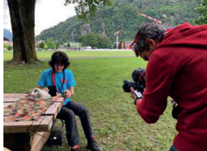
Specialità Trasmissioni & Specialità Foto e video-making: ciak, si gira!