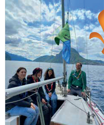
Specialità Acqua - Barca a vela: si salpa