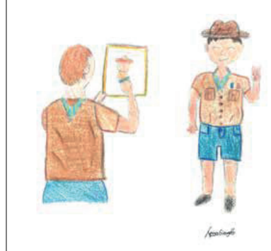
Specialità Disegno: super autoritratto