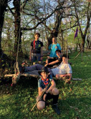
Specialità Pionierismo: qui nasce l'avventura