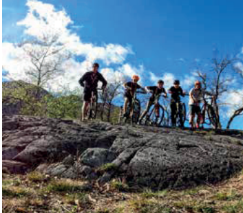
Specialità Ciclismo: in sella