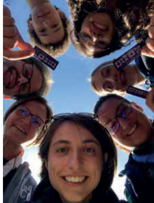
Specialità Culture e Scambi internazionali... conquistata!